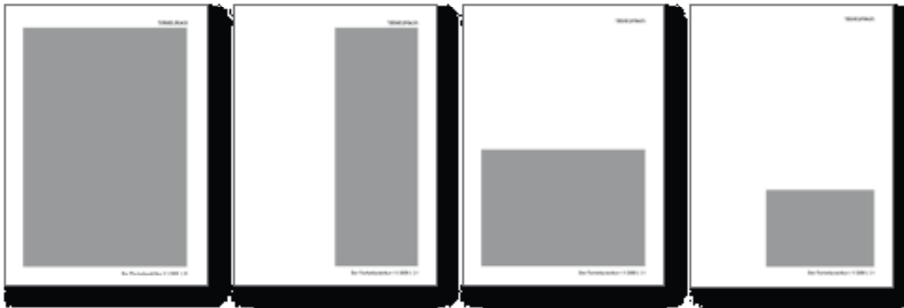
1/1 Seite hoch 170 x 249 mm 300,00 EUR*